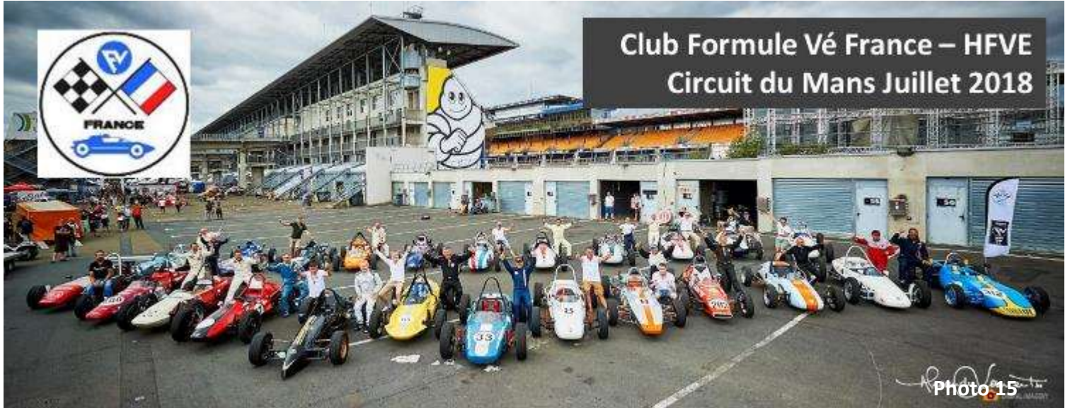
Club Formule Vé France – HFVE Circuit du Mans Juillet 2018