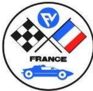
Photo 4 - Logo