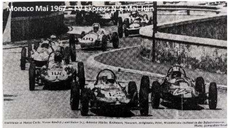
Monaco Mai 1967 – FV Express N°6 Mai-Juin