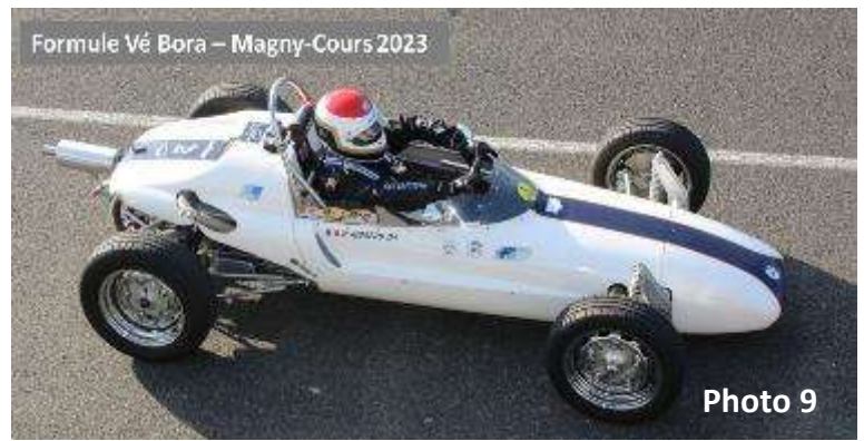
Formule Vé Bora – Magny-Cours 2023