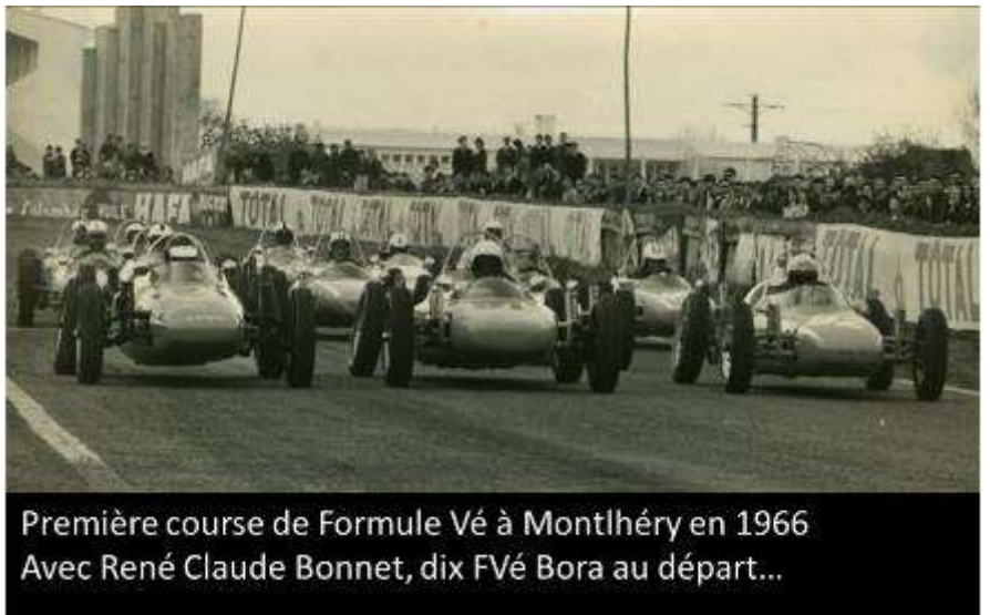
Photo 7 Première course de Formule Vé à Montlhéry en 1966 Avec René Claude Bonnet, dix FVé Bora au départ...